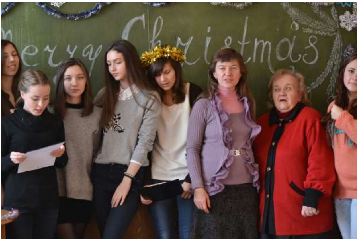
А це ми всі разом співаємо різдвяні пісні