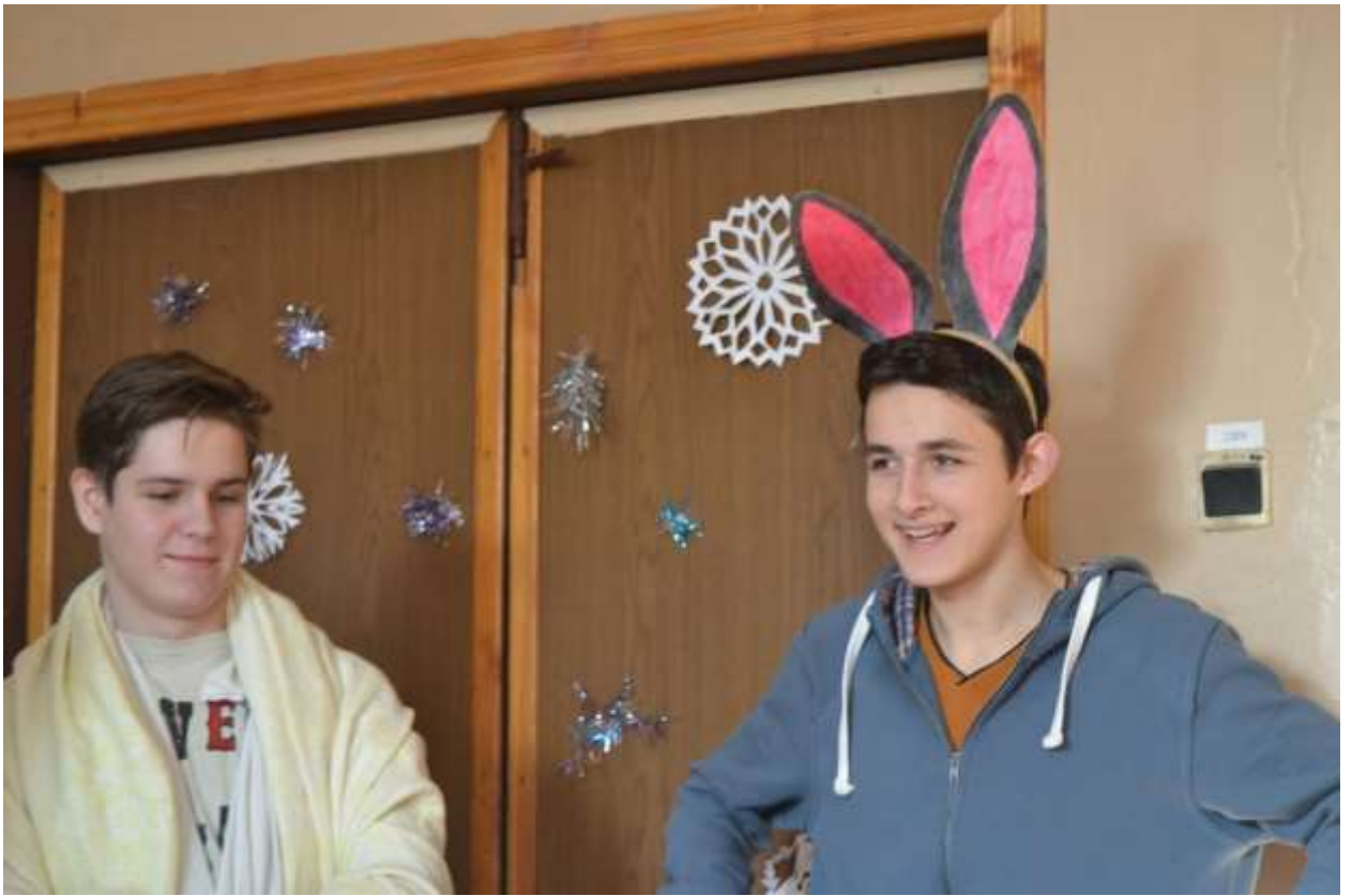
Під час подорожі до Віфлеєму