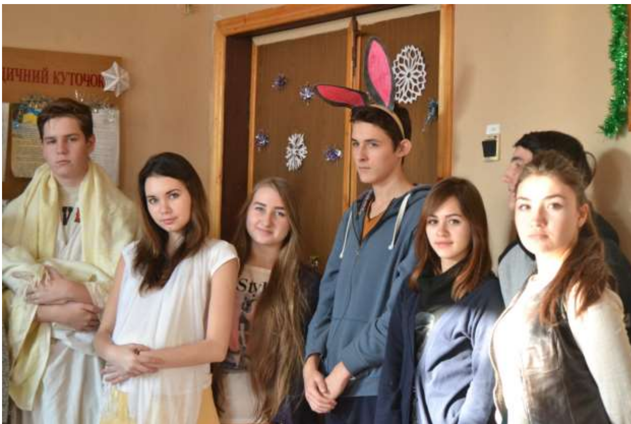
Джозеф, Марія, Святе Немовля, Віслучок та інші герої постановки за мотивами Біблейського писання