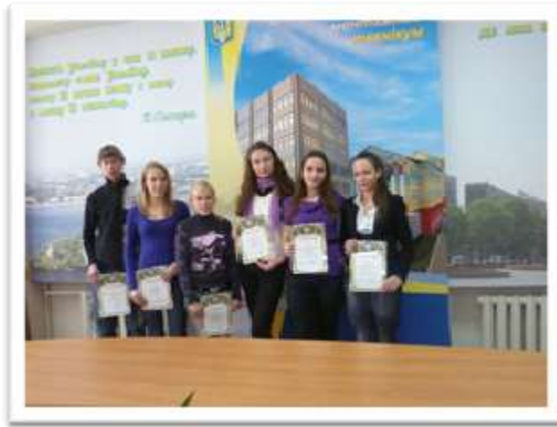
Студенти I-II курсів ДМТ, які є переможцями конкурсів