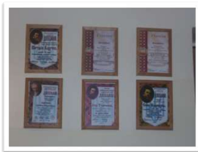
Дипломи переможців обласних етапів Міжнародного конкурсу з української мови ім. П.Яцика та Всеукраїнської олімпіади з української мови.